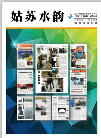
苏州市自来水有限公司内刊

为了配合民主评议政风行风活动的开展，2012年第四季度，公司与平面媒体联动，以《苏州日报》和《姑苏晚报》为主要阵地，连续报道了公司在服务民生、保障供水方面的具体措施，展现了苏水人默默奉献、任劳任怨的良好形象。现将这些报道汇总为专辑，以供查阅。